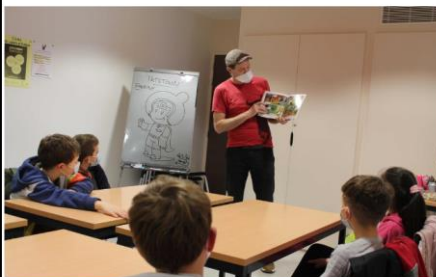
Tristoon explique aux jeunes la création d'une BD.