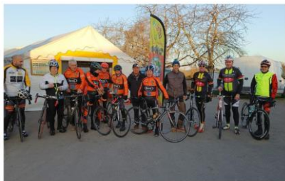
Les randonneurs prêts pour le départ

publié le 29 février 2022 à 11h55, modifié à 11h56.