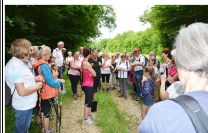
Le groupe de marcheurs près à récolter des arbres et des toutes choses.