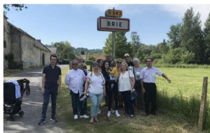
La délégation de Brie (en Charente) devant le panneau de Brie (dans l'Aisne).