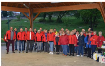
Une équipe de 50 bénévoles tout au long du parcours.