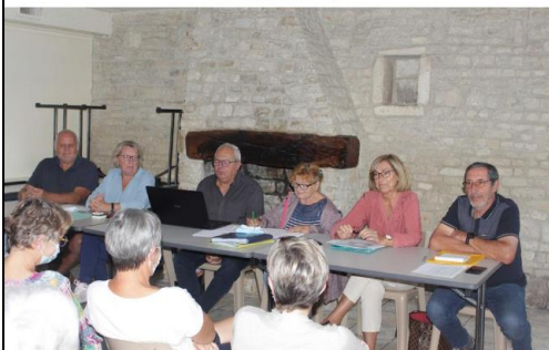
à bureau autour du président de l'association.