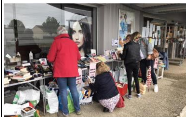
De la lecture à petit prix pour les vacances.